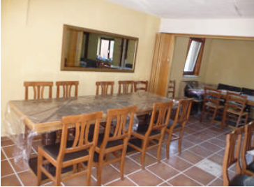
Übungsraum DGH Ortsmitte